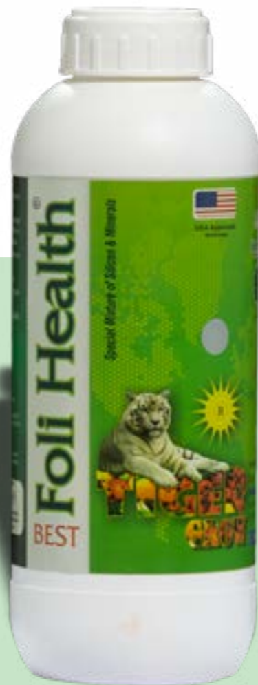
ثبت کودی: ۷۷۲۴۲

«بست فولی هلت» کودی محتوی درصد بالای سیلیکون و مخلوطی از سه نوع ماده سیلیکونی می‌باشد. بست فولی هلت علاوه بر سیلیکون (سیلیس) محتوی درصد چشمگیری پتاسیم مشتق شده از سیلیکات پتاسیم می‌باشد که باعث افزایش سایز و رنگ‌دهی بهتر محصول می‌گردد. برتری بست فولی هلت نسبت به رقبای استفاده از ماده اولیه‌ای بغیر از سیلیکات پتاسیم می‌باشد که باعث اضافه شدن کلسیم و گوگرد به این کود منحصربفرد می‌گردد، لذا همراهی عناصر قدرتمند پتاسیم، سیلیکون، کلسیم و گوگرد از این کود محصولی بسیار پر قدرت برای افزایش وزن و کیفیت میوه و کودی بسیار عالی جهت جلوگیری از بیماری‌های ویروسی و قارچی و تنش‌های محیطی می‌سازد.